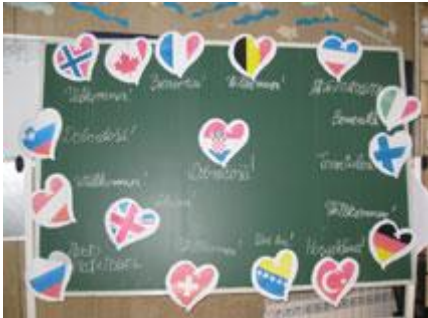
Večer predstavljanja zemalja