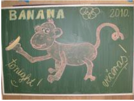
Luda večernja događanja: