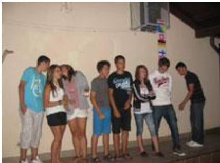
Ove godine, poslije Vojvođana, najbrojnija zemlja bila je Švicarska.