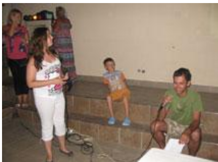
...i Miroslav; ...