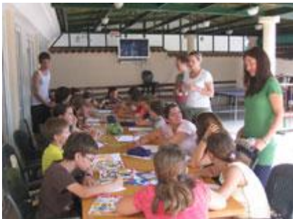
Uvijek najbrojniji – naravno NOVINARI!