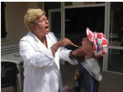
Teta Vesna! Grlobalje, uhobolje i ostale boljetice nestaju za tren ....