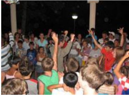
Hip hop večer za pamćenje, ...