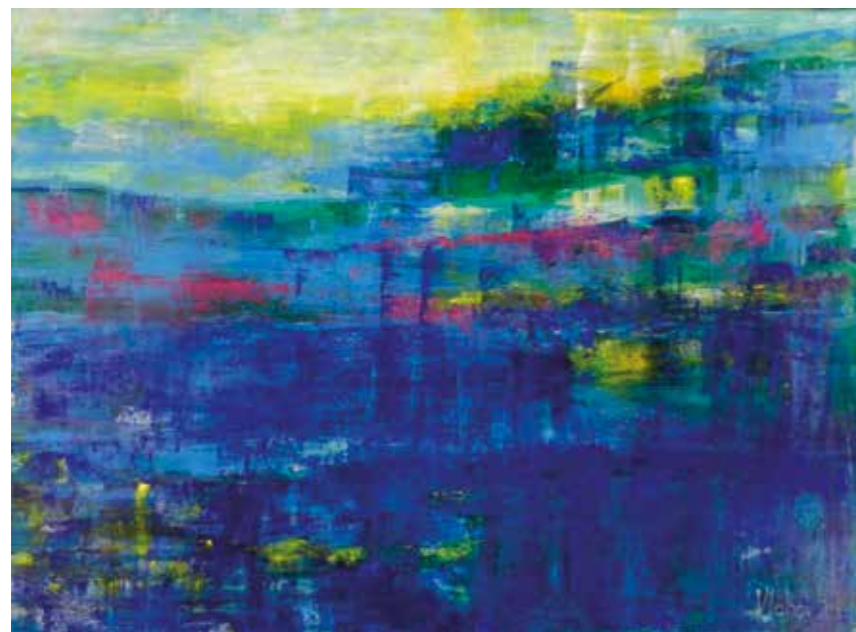
MORE | Akril | 80 x 60 cm | 2010