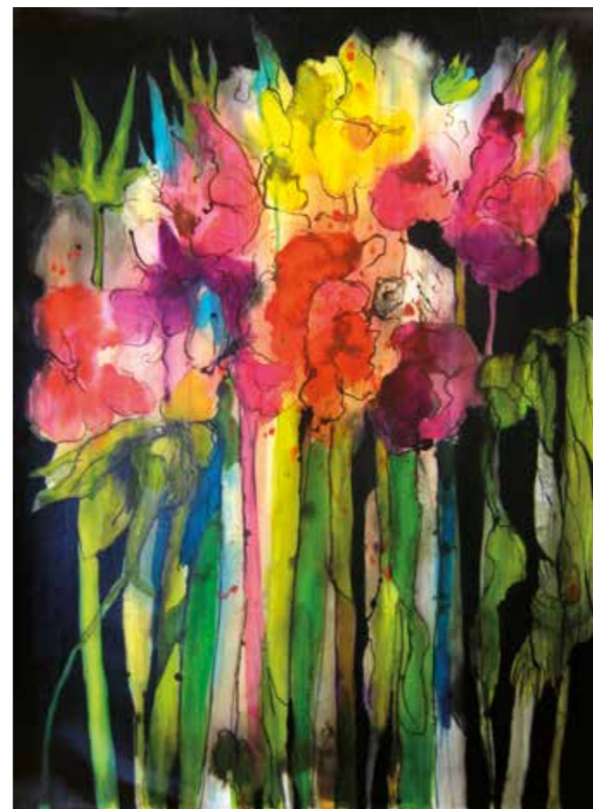
ANEMONEN | Akvarel – Tuš | 50 x 70 cm | 2012