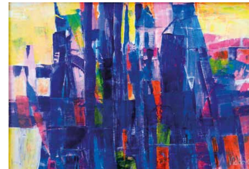
TVRĐAVA | Akril | 70 x 50 cm | 2009