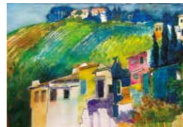
ISTARSKI VINOGRADI Akvarel | 70 x 50 cm | 2013