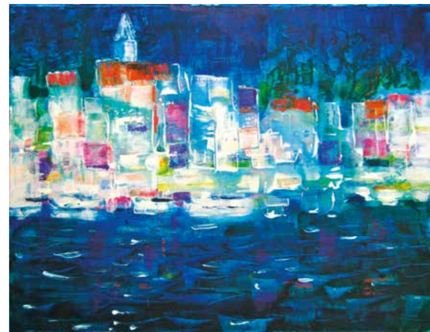
KRAPANJ U BURI | Akril | 75 x 57 cm | 2014