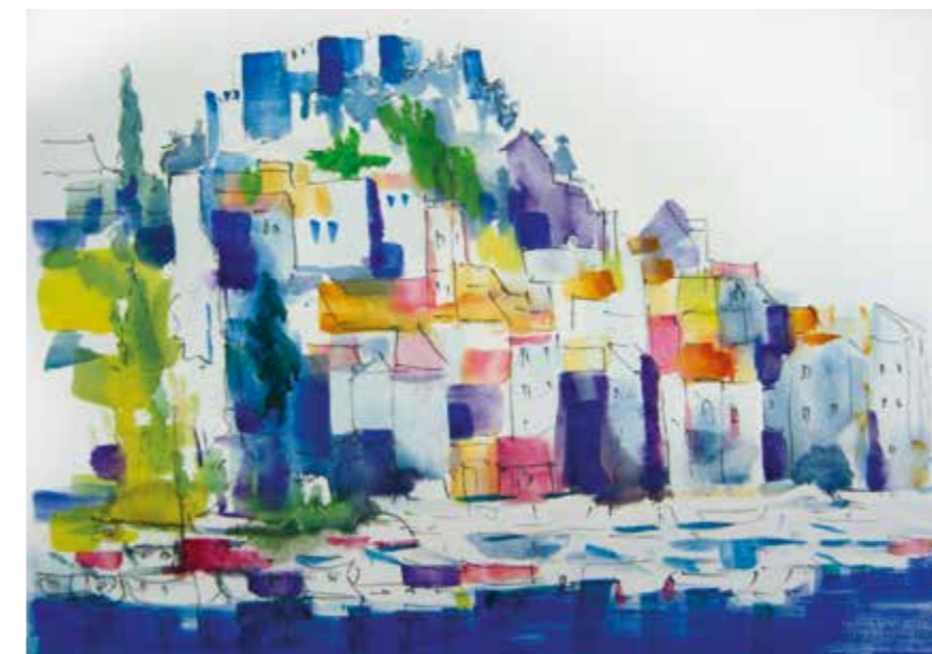
ŠIBENIK – DOLAC | Akvarel | 68 x 48 cm | 2010