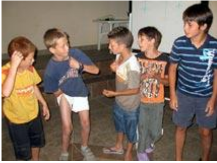
Dečki protiv cura ili