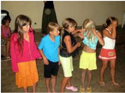
Cure protiv dečki!